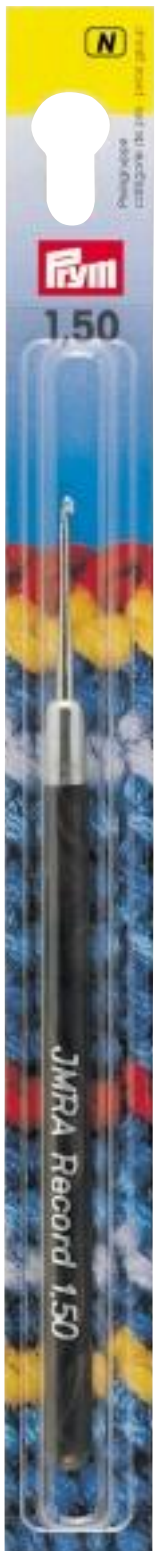
Originalgröße 20 x 205 mm