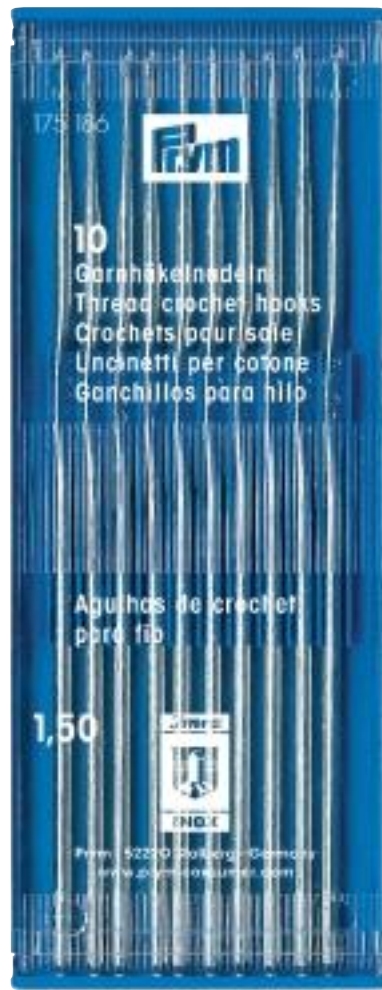
Originalgröße 50 x 130 mm