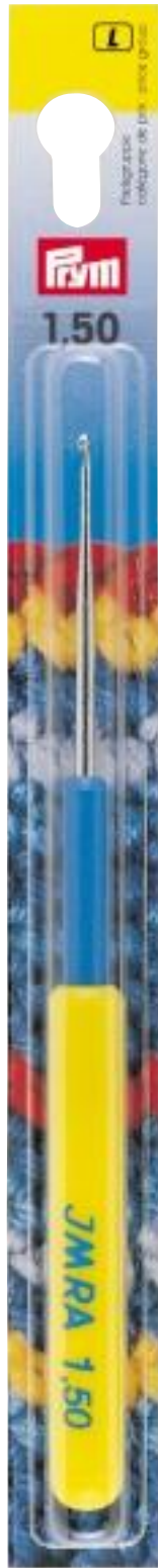
Originalgröße 20 x 205 mm