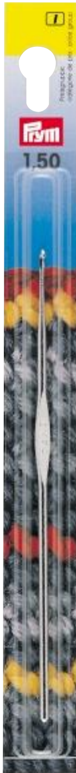
Originalgröße 20 x 205 mm